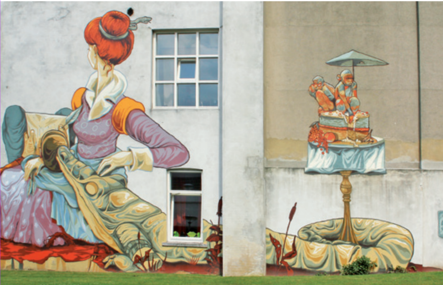
↑ Luciushof, gevel Savelbergklooster (ingang Gasthuisstraat 2) Rookie (BRD) / Hommage aan De Sterke Vrouw