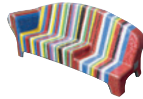
← Wilhelminaplein Erol Oztan / variatie op de Europese vlag van Rem Koolhaas