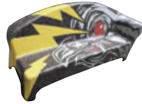
← Wilhelminaplein Vincent Lancee / Stadsvogel

Naast de al eerder afgebeelde murals op de Morenhoek en het Schelmenhofje zijn er ook nog murals te bewonderen in de nabijgelegen tuin van het Savelbergklooster en op het Beta-plein. Het fleurt de stad en haar omgeving op en creëert een internationale sfeer. Urban Heerlen. Ook is er een Social Sofa's route. Vraag naar de folder bij de VVV.