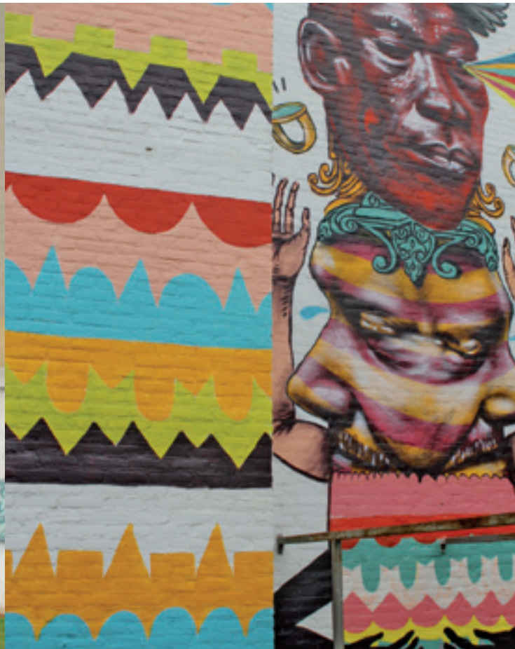
↑ Betaplein / Troy Lovegates / Other