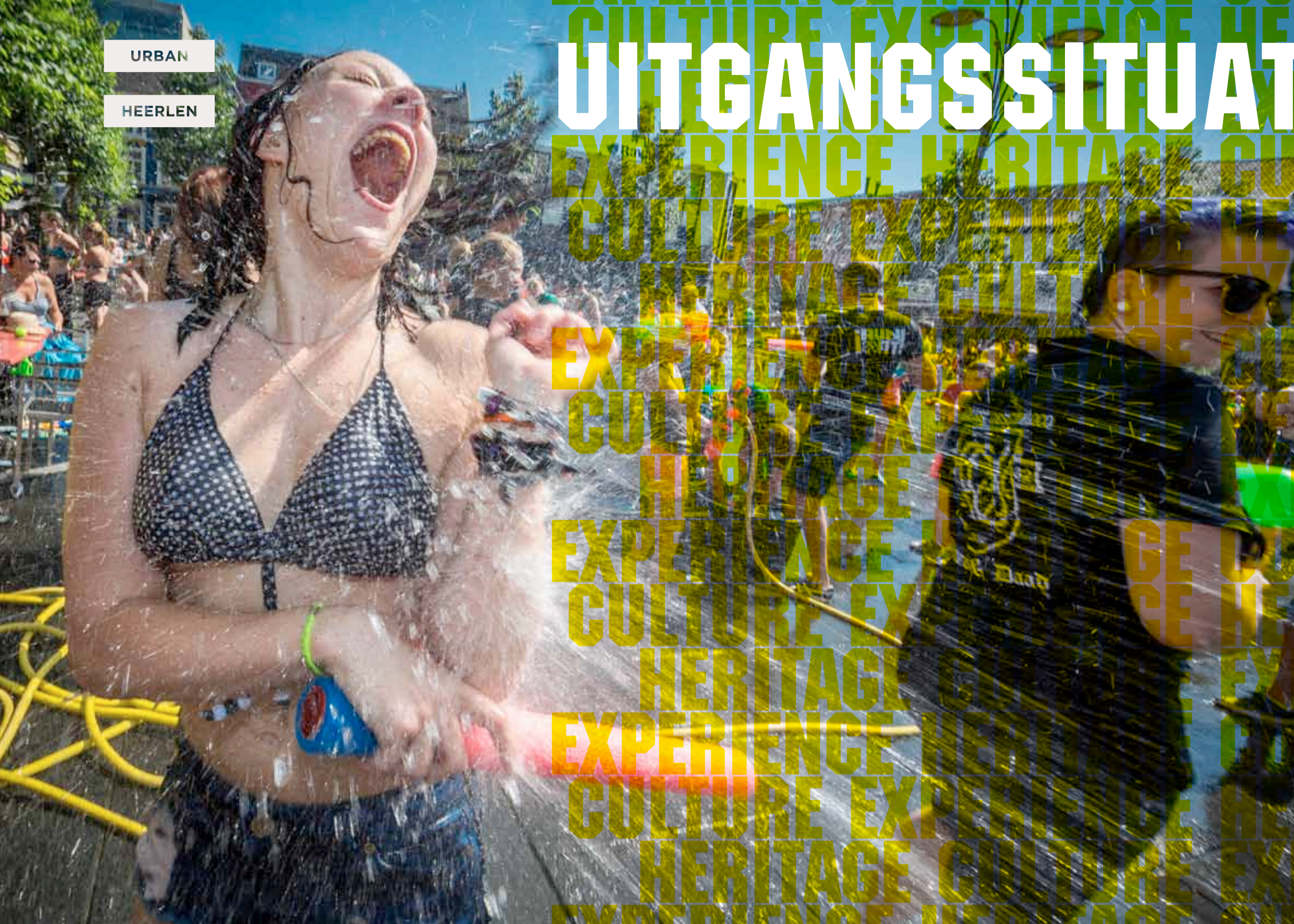
SPLASHMOB / PANCRATUSPLEIN HEERLEN