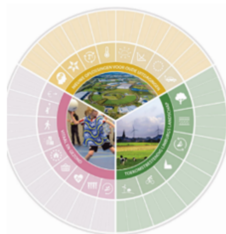
Figuur: Opzet afwegingskader Parkstad

De Heerlense invulling van het participatietraject en de verschillende in te zetten middelen en kanalen beschrijven we in een startnotitie.